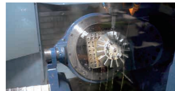
テーブル面に対して横からの切削でも、ワークがずれない