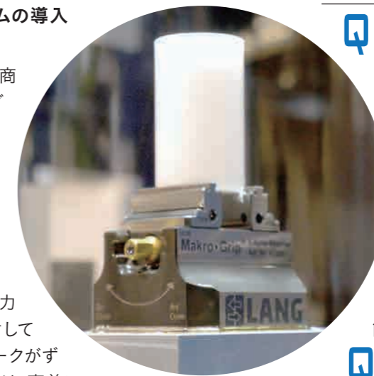
樹脂のワークも しっかり把持する

A 従来のバイスでは、切削力がか機械のテーブル面に対して水平方向に掛かる場合に、ワークがずれやすかった。マクログリップでは、事前にワークの把持部分に凹凸の溝を付け、その溝にバイスの口金に付いた凹凸の爪をかみ合わせて挟み込む。そのため、弱い把持力でも横からの力に強く、どの角度から工具を当てて切削しても、ワークがずれずに加工不良も減りました。また、高い切削条件で加工できます。